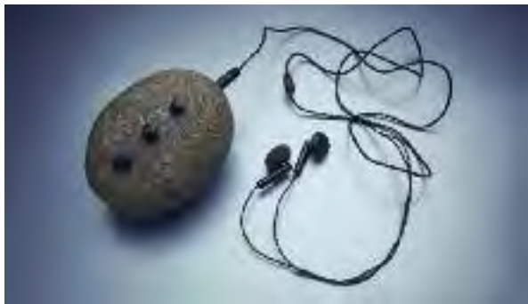
Silje Villhodd: «Audio device»

www.vinjehandverkslag.no , post@vinjehandverkslag.no