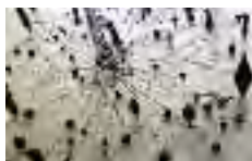
«Arvegods», detalj» av Kari Steihaug

Opning søndag 1. juli kl 17. Ope kvar dag 11 – 18 fram til 22. august. Bill. kr 50,-. Medl./barn gratis. 1. etg. gratis inngang