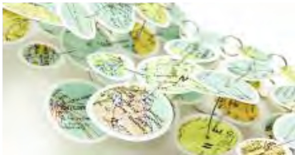
«Belongings global» av Marie Asbjørnsen

Postboks 81, 3835 Seljord. Kunstlåven tlf. 3505 0355 info@seljordkunstforening.no, www.seljordkunstforening.no